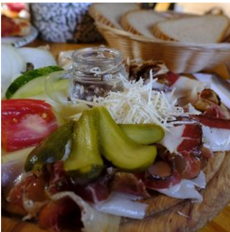
Bild Steinbruch St.Margarethen