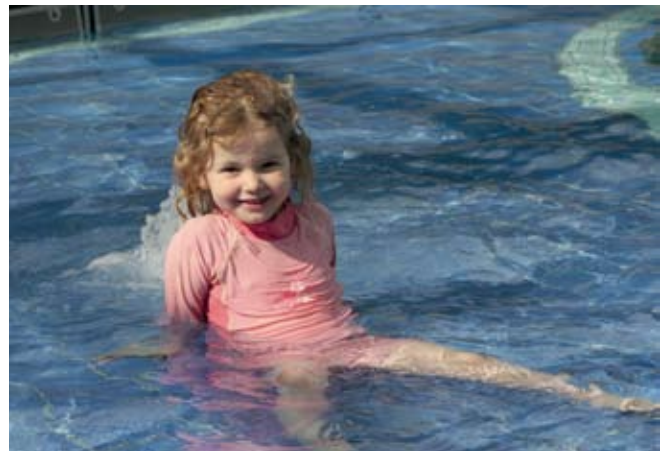
Auch die Kleinsten haben Ihren Spaß im Pool auf dem Schiffsdeck.