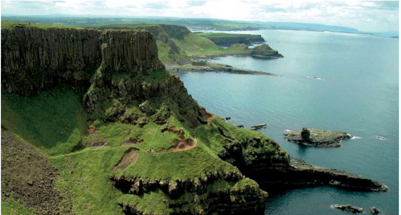
Cliffs of Moher

Wiesen mit uralten Klosterruinen und Grabsteinen, Moore und atemberaubende Steilküsten: Doch nicht nur die grandiose Landschaft wird Sie begeistern, sondern auch die Menschen und ihre Städte. „In Irland hat jedes vierte Haus eine Kirche“, sagt Ihr Scout, „und jedes dritte eine Kneipe“. Im Pub können Sie sich davon überzeugen, dass den Iren ihre Kneipen heilig sind.