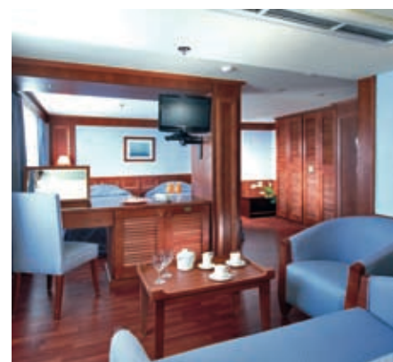
Beispiel 2-Bett Suite, MS NILE EXCELLENCE